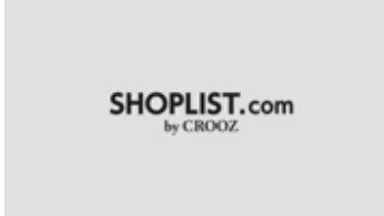
ショッピングリスト♪