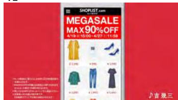
ショッピングリストの メガセール