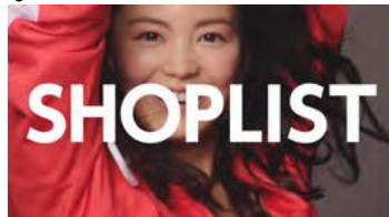
ショッピングリストは