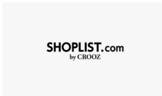
ショッピングリスト♪