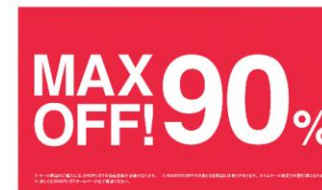
MAX 90% OFF