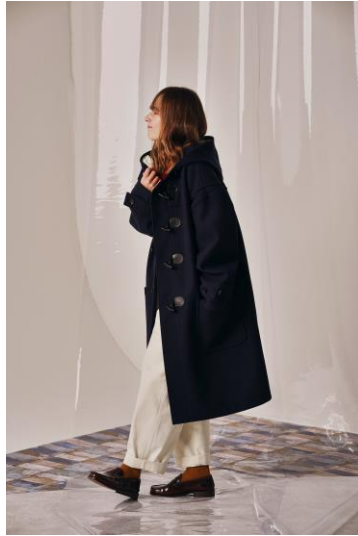
duffle coat (¥30,800) high waist tuck chinos (¥9,900)