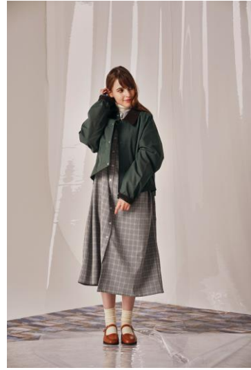
short work jacket (¥18,700) volume sleeve check one-piece (¥12,100) long pearl necklace (¥6,900)