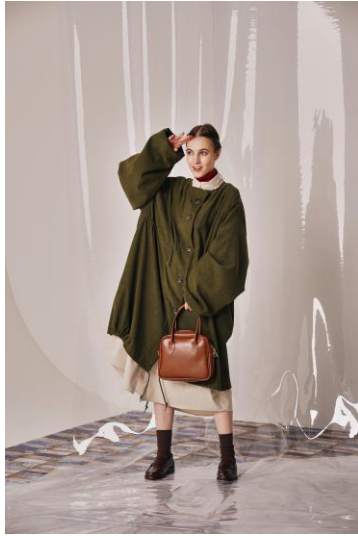
gas coat (¥19,500) turtleneck knit (¥9,900) volume sleeve one-piece (¥11,000) ecoleather boston bag (¥5,900)